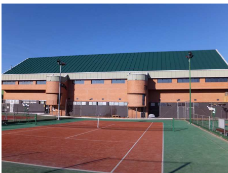
Pabellón vista exterior

Los desayunos, comidas y cenas se llevaran a cabo en el Restaurante del Club Polideportivo Juventud.